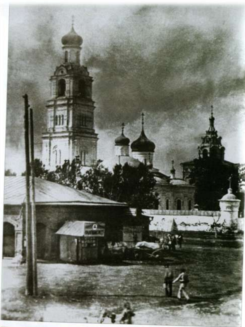
ТЕМНЫЙ ПЕРИОД В ИСТОРИИ ОБИТЕЛИ