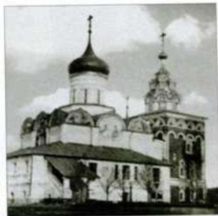
Благовещенский и Спасский храмы. Вид с юго-запада. Конец 20-х годов XX века

В 1924 году древние храмы обители – Благовещенский собор с усыпальницей преподобного Романа Киржачского, Спасский и Сергиевский храмы, были внесены в «Список охраняемых государством памятников истории и архитектуры Владимирской губернии» и поставлены на учет в музейном отделе Главнауки Наркомпроса РСФСР (НКП). Это во многом определило их дальнейшую судьбу – до конца 90-х годов XX века она решалась в противоборстве государственных культурно-охранительных организаций с органами местной власти.