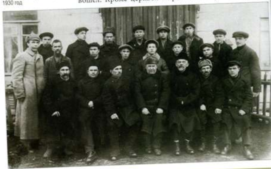
Темный период в истории обители

свое распоряжение братский корпус XVII – XIX веков (двухэтажный кирпичный дом, в котором до революции размещался причт), крытый железом сарай «для хозяйственных нужд» и церковный магазин, построенный в старой монастырской ограде в начале XX века.