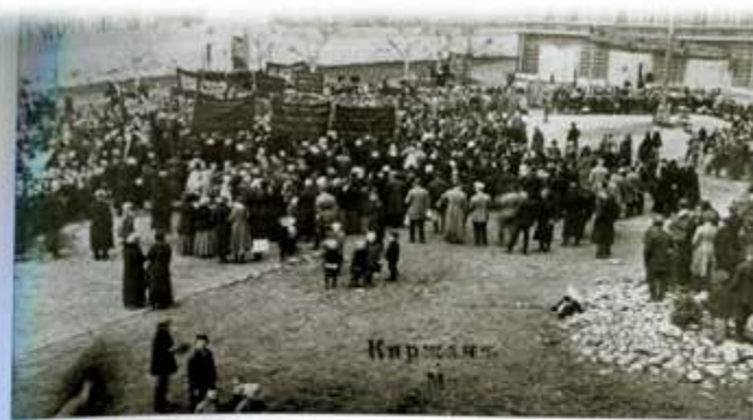
▲ Первомайская демонстрация у стен Киржачского Благовещенского м. 1919 год

П осле Октябрьского переворота 1917 года началось постепенное разорение храмов, находившихся на территории древней Киржачской обители.