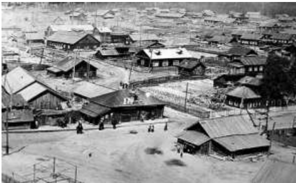
Пинюг (50-е гг. XXв.)

Что же нам известно о нём? Купеческий сын, участник Первой мировой войны. Упомянут 03 августа 1912 г. в "Списке лиц по г. Киржачу, имеющих право участия в первом съезде городских избирателей по выборам в Государственную Думу в 1912 голу". Часть: 1. Владельцы торговых предприятий первых двух разрядов, промышленных первых пяти разрядов и пароходных, с которых уплачивается промысловый налог не менее 50 рублей в год. Умер 22 апреля 1931 г. в ссылке на станции Пенюг (г), Архангельской области. Там и похоронен. Пенюг... Что это? Небольшой посёлок и лагерь для ссыльных. На фотографии его вид в 50-е гг. XX в.