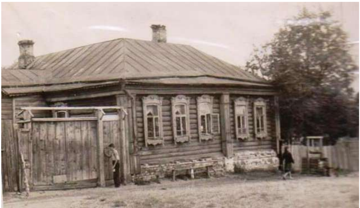
Дом Стрельцовых на ул. Морозовская (быв. Сергиевская) (60-70-е гг. XXв.)