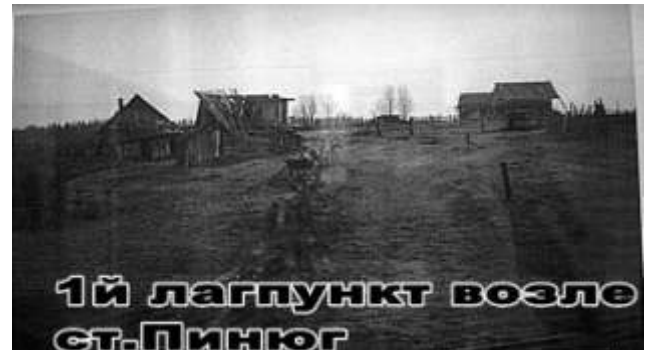
Ст. Пинюг (50-е гг. XX в.)