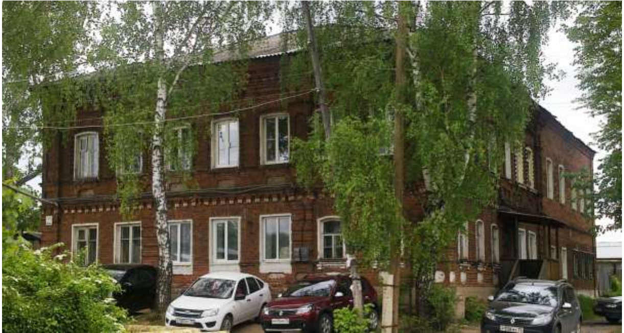
Ул. Морозовская, д.22

Дом располагается на пересечении улиц Морозовской (быв. Сергиевской, второе название Ново-Сергиевской) и Серёгина. Надо заметить, что целый квартал Сергиевской (Ново-Сергиевской) улицы, ныне занимает территория ОАО Киржачского инструментального завода.