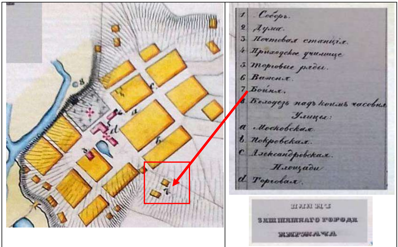
План г. Киржача за 1856 г.

Улицы Сергиевская (ныне ул. Морозовская) и Михайловская (ныне ул. Свободы) и другие улицы, расположенные ниже от центра города в сторону современного городского озера, сформированы в основном домами семей крестьян переселившихся в город после расширения шёлковых производств с сер. XIX - нач. XX вв. Здесь выделялись земли под постройку домов или для установки домов, перевезённых из села.