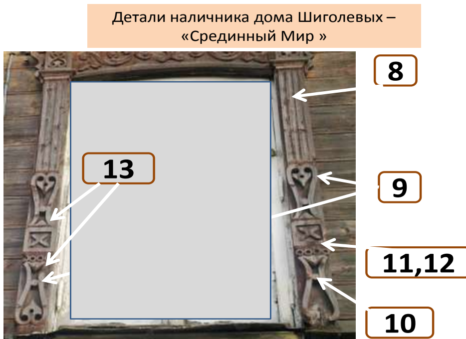
Рис. 2. «Срединный мир» - детали наличника дома Шиголевых по ул. Гагарина современный вид (2015 г.)