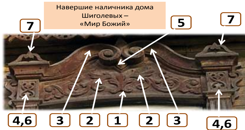
Рис.1. - Навершие (мир Божий) наличника дома Шиголевых по ул. Гагарина современный вид (2015 г.)